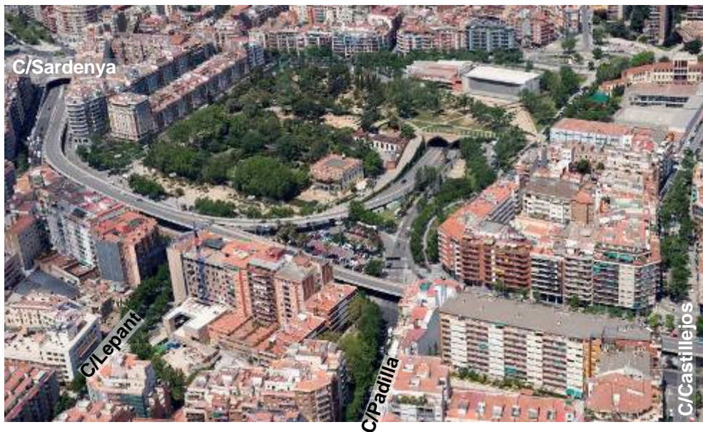
Situació inicial àmbit d'actuació

En un principi, aquesta estructura consistia en dos taulers amb la mateixa secció transversal. Fins ara només se'n mantenia un (sentit de circulació Llobregat), ja que el de la banda mar es va demolar als anys 80