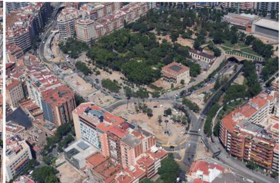
Avanç dels treballs a 13/07/2009

Contractista: UTE CRC-RUBATEC Inici obra: Febrer 2009 Fi d'obra: Agost 2009