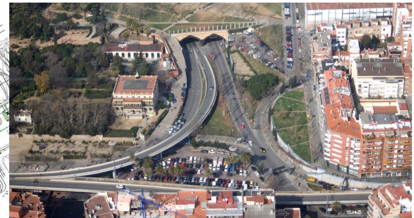
Vista aèria situació inicial boca sud túnel (22/02/08)

Enderroc del viaducte existent (Finalitzat agost 2009)