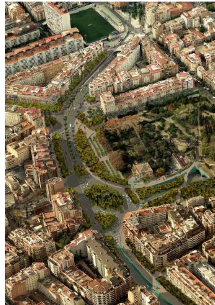
Imatge virtual de la proposta